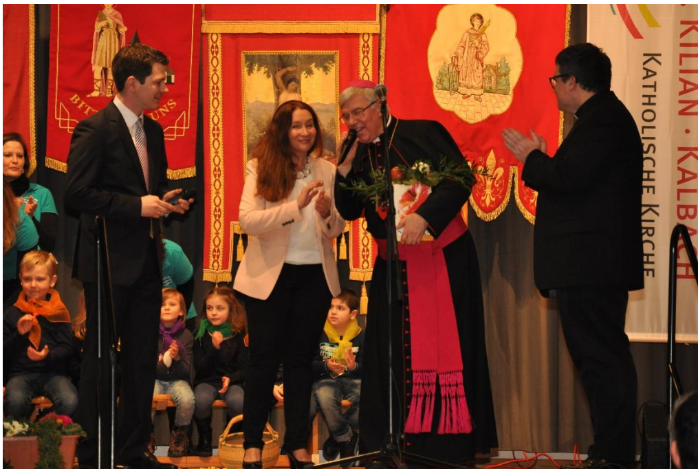
Empfang im Bürgerhaus