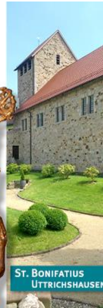
ST. BONIFATIUS UTTRICHSHAUSEN