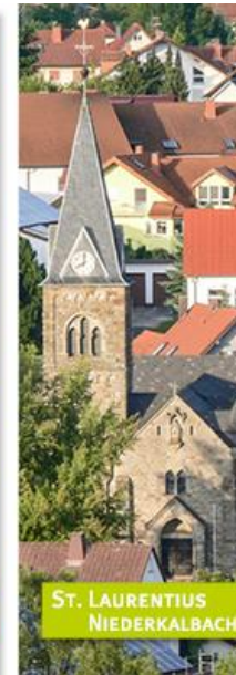
ST. LAURENTIUS NIEDERKALBACH