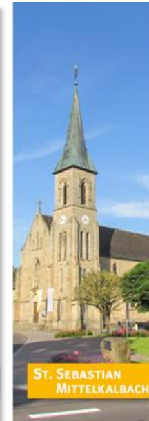
ST. SEBASTIAN MITTELKALBACH