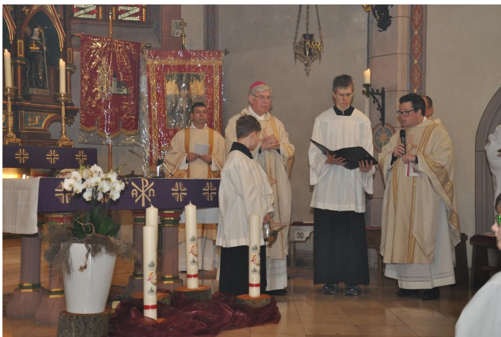
Eucharistiefeier mit Weihbischof