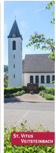
ST. VITUS VEITSTEINBACH

1. Januar 2016 – Gründung der neuen Pfarrgemeinde St. Kilian